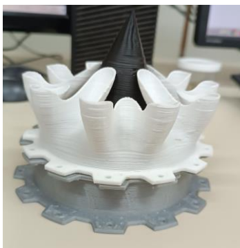
Figura 7. Bocal da turbina.

Devido à complexidade dos componentes, testes de impressão e problemas na obtenção de um modelo de rolamento específico, não foi possível apresentar esses projetos em sala de aula no prazo previsto.