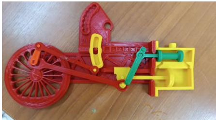
Figura 5. Esquema de locomotiva semi-aberto.

No caso da locomotiva, mostrada na figura 5, a dificuldade em encontrar os rolamentos necessários levou à impressão de peças alternativas para garantir um funcionamento semelhante.