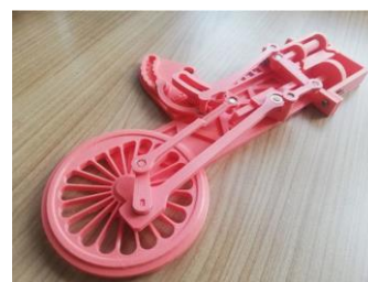
Figura 2. Esquema de locomotiva a vapor aberto escolhido.

Para a parte de máquinas térmicas, foram selecionados dois projetos do Thingiverse, incluindo um esquema de locomotiva a vapor aberta ( https://www.thingiverse.com/thing:4848718 ), mostrado na figura 2, que foi impresso primeiro por ser mais simples e com menos peças.