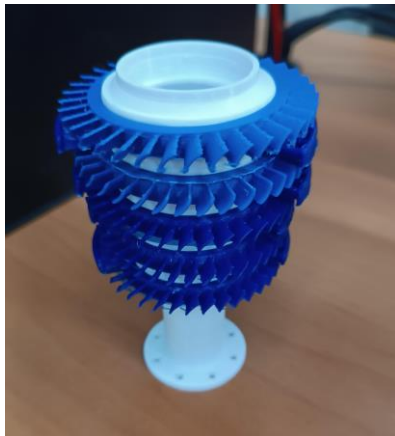
Figura 6. Compressores de alta pressão.

Já para a turbina, duas principais partes foram montadas, compressores de alta pressão (Figura 6) e o bocal de saída (Figura 7).